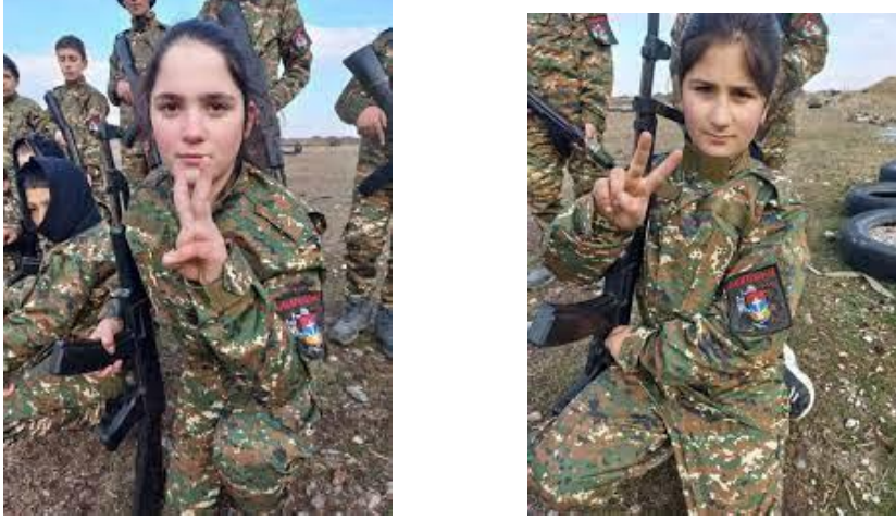
Görsel 3. Ermeni çocuk askerler