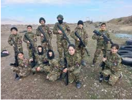
Görsel 6. Ermeni çocuk askerler

İkinci Karabağ Savaşı'nda çocuk asker kullanımının münferit bir olay olmadığı, yıllardır devlet eliyle inşa edilmeye çalışılan “toplumsal mititarizasyon” sürecinin bir sonucu olduğunu, Nisan 2017'de Ermenistan Eğitim ve Bilim Bakanı Levon Mkrtchian'ın ifade ettiği şu sözler kanıtlamaktadır: “Askeri bilim uzmanları çocuklara silahları sevmeyi ve onlardan korkmamayı öğretmelidir. Silahlar sevilmeli, değer verilmeli, bakılmalıdır. Herkesin potansiyel bir asker olduğu bir bölgede yaşıyoruz ve bu doğal olarak eğitim sistemini etkiliyor; bu kavram okulların birincil görevi olmalıdır” (Abrahamyan, 2017). Daha önce de ifade edildiği gibi İkinci Karabağ Savaşı öncesinde de Ermenistan'ın çocuk asker kullandığı, uluslararası raporlara yansımıştır. Bununla birlikte “çocuk asker” olarak nitelendirilebilecek bir yaşta bizzat sahada olan Ermenilerin de bu yönde beyanatları mevcuttur. Örneğin, kendisiyle mülakat yapılan Armen Hovannissian, Birinci Karabağ Savaşı'na katıldığında 15 yaşında olduğunu söylemiştir (Iskandar, 15 Mayıs 2022).