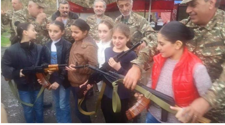
Görsel 7. Ermeni çocuk askerler

olarak kullanan Erivan, çocukların açıkça askeri hedefler haline gelmelerine, dolayısıyla da en temel çocuk haklarından, özellikle de yaşam hakkı ve korunma hakkından mahrum olmalarına neden olmaktadır (Dev.Report.Az., 15 Mayıs 2022).